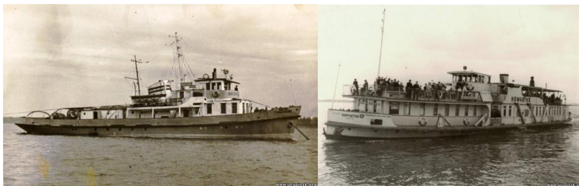
Рис. 7. Катер «Виктор Талалихин» (слева), пассажирский катер «Камчатка» на Хопре (справа)