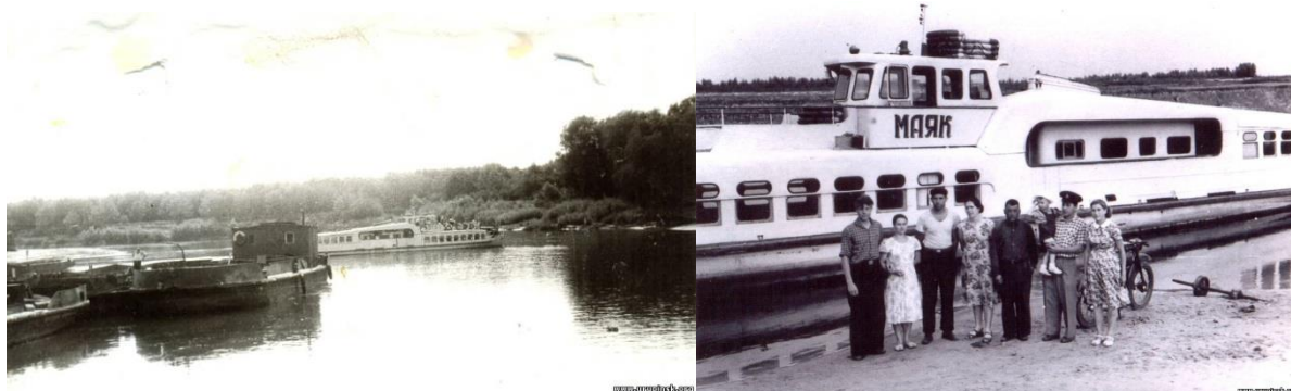
Рис. 4. На пристани (слева), «Маяк» на переправе (справа)