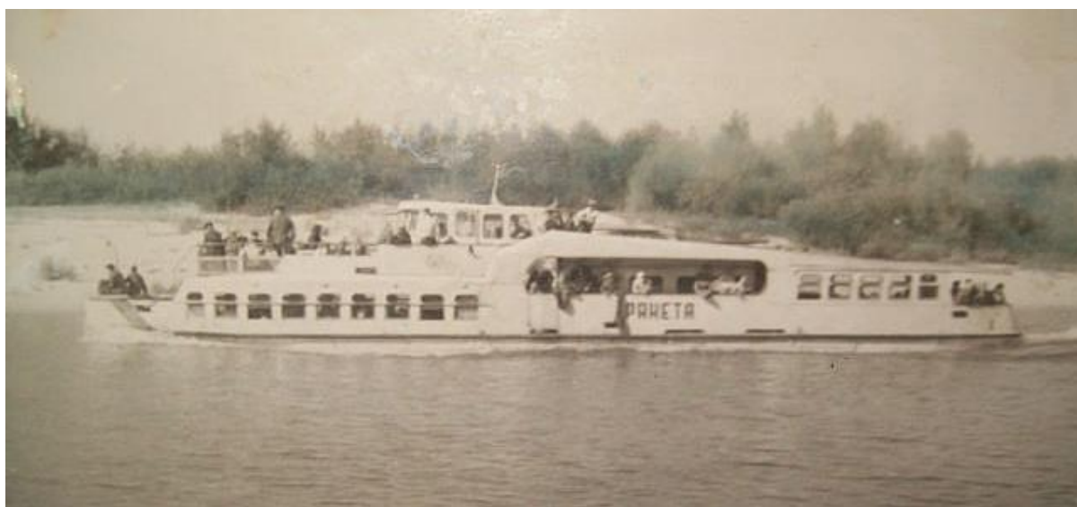
Рис. 5. Катер «Ракета»