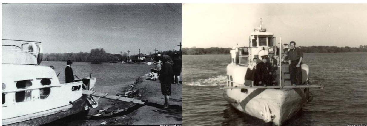
Рис. 6. Вода доходила до улицы Малопесчаной, катер подвозит пассажиров (слева), скоро причалим к берегу (справа)