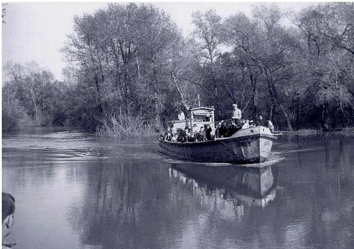
Рис. 3. Катер проекта 792. Катер в проходе между озером Подлесочное и Хопром (слева)

Следующая серия снимков запечатлела катера проекта 222. Первый из них, это «Мир», построенный на Красноярской верфи в 1959 г. Владелец судна было Волго-Донское речное пароходство с припиской в Ростове на Дону. В октябре 1962 г. судно перепрофилировали в бассейновый узел связи и радионавигации с переименованием в ПТЛ-1, и списали в 1978 г. ( fleetphoto.ru ).