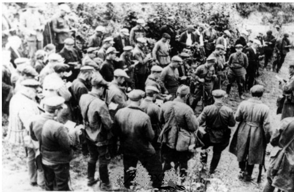
Рис. 3. Партизаны отряда «Боевой клич» принимают присягу перед первым походом. Окрестности Кестеньги. 1941 г.

В интернете была обнаружена одна из немногочисленных фотографий, имеющая непосредственное отношение к отряду «Боевой клич» (Рисунок 1).